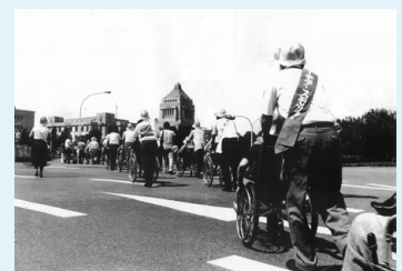
スモンの闘い 国会へ向かって！