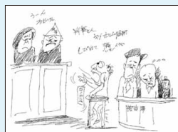
スモン被害者の絵