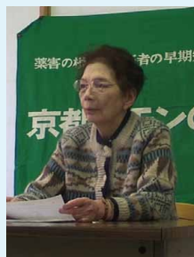
被害者の証言トーク