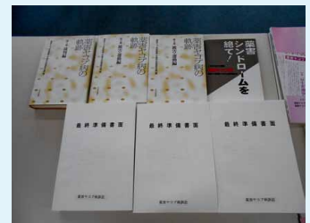
薬害ヤコブ病裁判資料