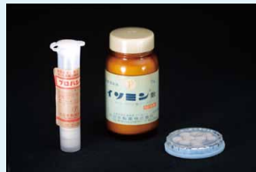
サリドマイド製剤