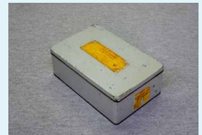
キノホルム 1000 錠入り缶